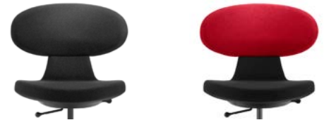
_1 Monochrome Éénkleurig