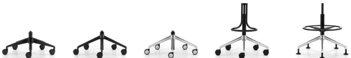
_1 5-prong base, black plastic, castors 5-teens kruisvoet, kunststof zwart, wielen